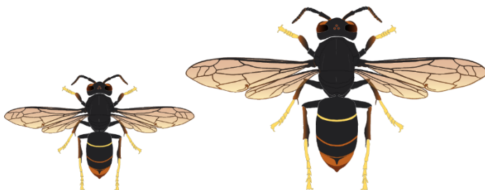
Fondatrice (20 à 32 mm)

Les comptages sont à faire au moment du renouvellement de l'appât. Le renouvellement est conseillé 1 fois par semaine pour une efficacité optimale du piégeage. Compter les fondatrices et ouvrières de frelon à pattes jaunes en les distinguant d'abord du frelon d'Europe. Les fondatrices se distinguent des ouvrières par leur taille.